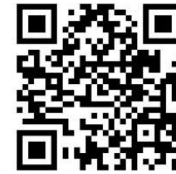
23 Villa Imstenrade