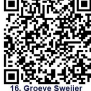
16. Groeve Sweijer