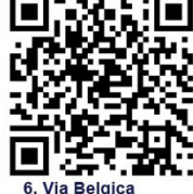
6. Via Belgica