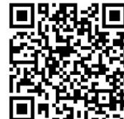
1. Abdijs St. Benedictus