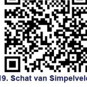
19. Schat van Simpelveld