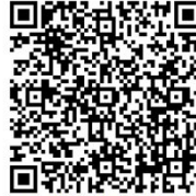
12. Wapen Simpelveld